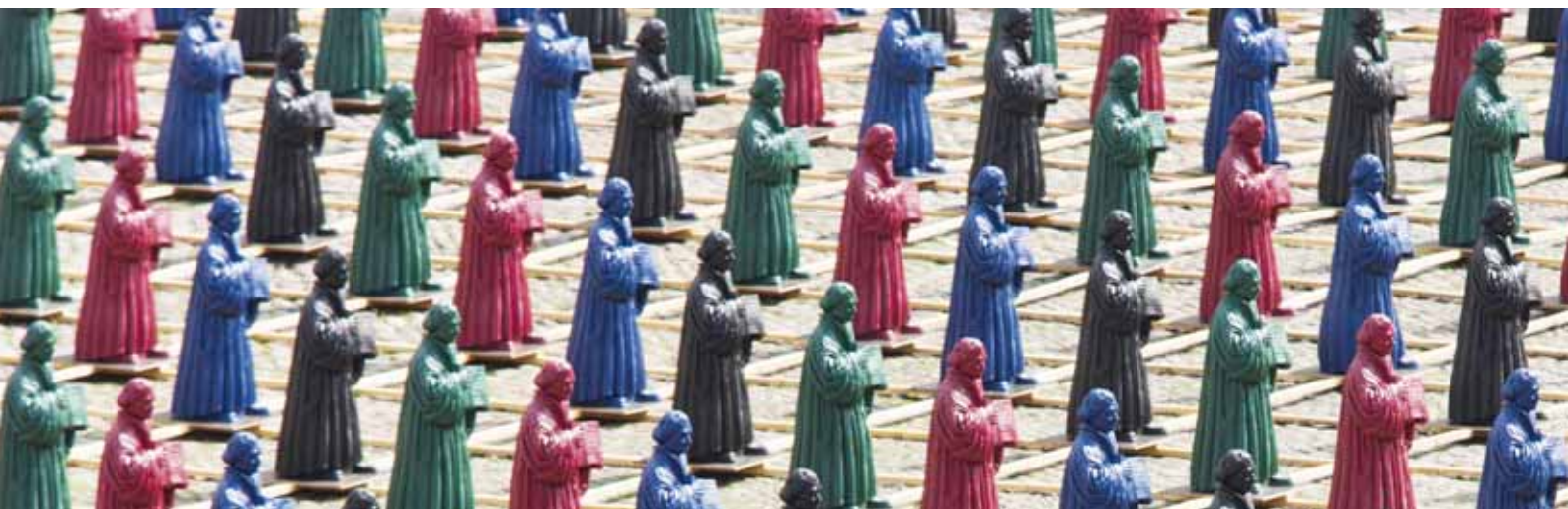
Bild unten: Ottmar Hörl Martin Luther: Hier stehe ich ..., 2010 Installation auf dem Marktplatz der Lutherstadt Wittenberg

Sehr geehrte Frau Bundeskanzlerin, setzen Sie auf europäischer und G20-Ebene durch, dass eine Finanztransaktionssteuer noch in 2011 eingeführt wird. Die Steuer würde einen Beitrag zur Regulierung der Finanzmärkte liefern und brächte Einnahmen für weltweite und öffentliche Angelegenheiten wie Gesundheit, Bildung, Trinkwasserversorgung und die Bekämpfung des Klimawandels.